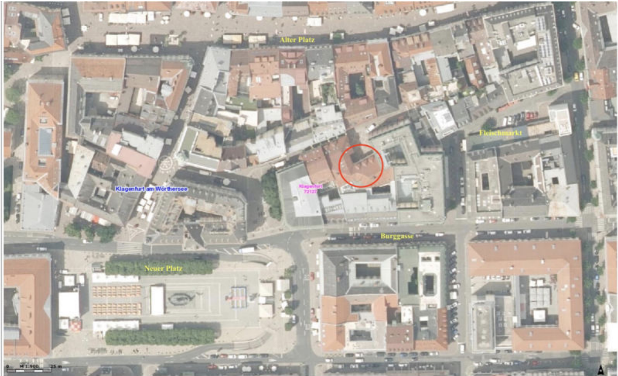
KADIS Standard-Ausgabe: Es wird keine Gewähr für die Richtigkeit und Vollständigkeit der angegebenen Informationen übernommen.